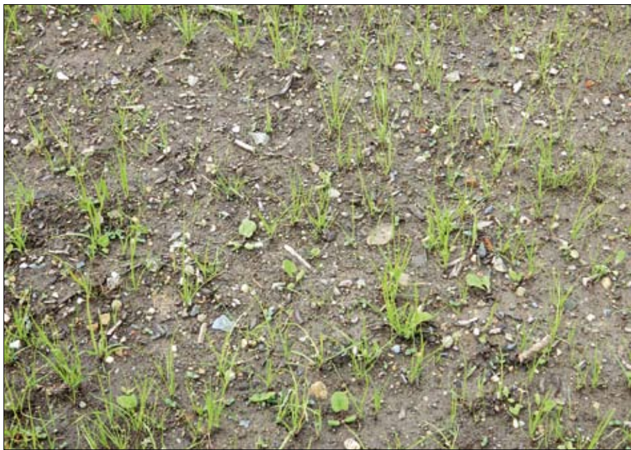
Obr. 7: Vrcházející porost směsi trav a vytrvalých dvouděložných bylin.