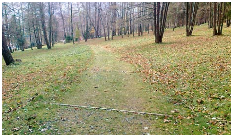
Obr. 22: Použití štěrkového trávniku s převahou travních druhů na cestách v lázeňském parku.

na žádoucí retence v místech, kde se v dnešní době obvykle navrhuje beton nebo asfalt. Právě vsakovací schopnost při současné zatížitelnosti zpevněných vegetačních substrátů ve štěrkových trávnicích zvyšuje značný ekologický význam těchto ploch. Podstatným přínosem použití štěrkových trávníků je podpora biodiverzity na dané lokalitě a z pohledu