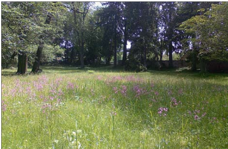
Obr. 13: Travo-bylinný porost pro vlhčí stanoviště s výrazným koetením druhů jako pomněnka, pryskyřník, kohoutek aj.