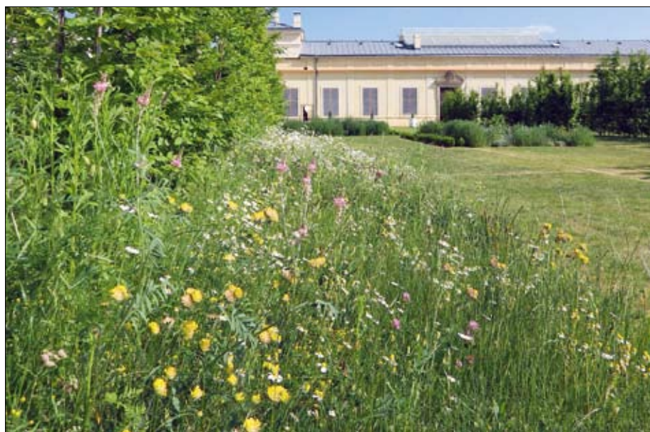
Obr. 17: Travo-bylinný porost v druhém roce po výsevu připravený k pokosení. Část kvetoucích bylin již vytvořila semena.

První kosení po založení květnaté louky se provádí zpravidla při výšce porostu 20–30 cm na výšku kolem 8–10 cm. Hlavním cílem prvního kosení je potlačení jednoletých plevelů v porostu a zlepšení světelných podmínek pro pomaleji se vyvíjející druhy. Jako nejvhodnější žací ústrojí pro tento účel se jeví lišťová žací sekačka, příp. na malých plochách ruční kosa, které jsou nejšetrnější vůči mladým rostlinám. Alternativně lze použít i rotační žací sekačku nebo motorovou kosu, ale vždy pouze s dobře naostřeným nožem či kotoučem. Tupý nůž nebo dokonce žací struna jsou pro první pokos nevhodné, neboť způsobují vytahování mladých rostlin z půdy. V dalších letech je prováděna zpravidla