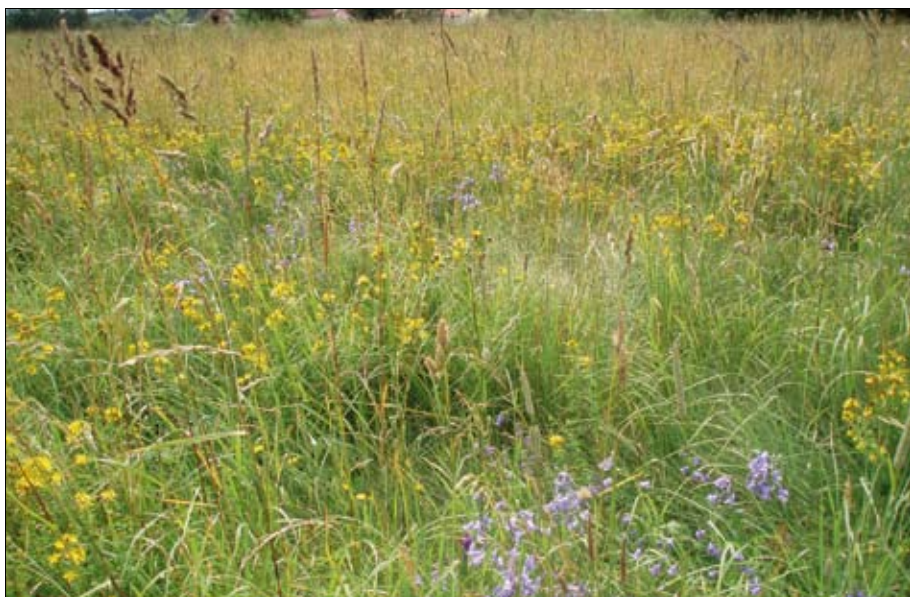
Obr. 14: Polopřirozená louka na mezofytním stanovišti (Arrhenatherion).