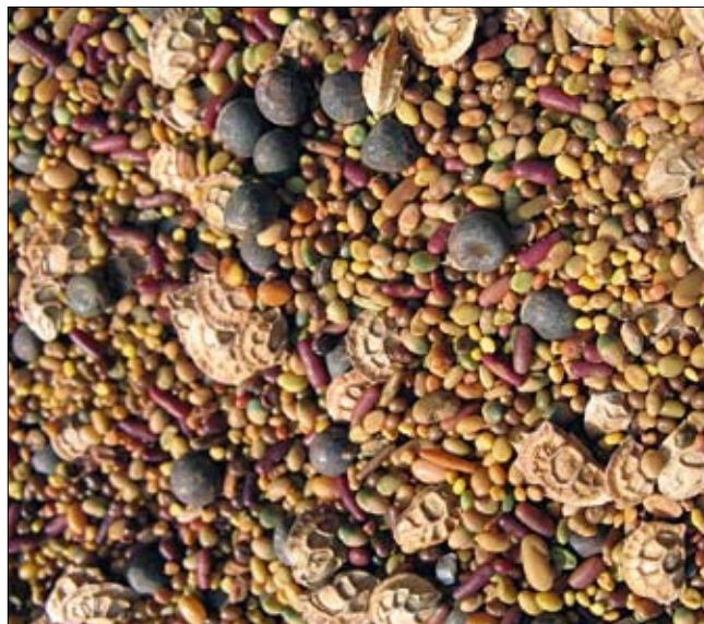
Obr. 6: Druhově pestré výsevní směsi ukazují velkou variabilitu ve velikosti tvaru a hmotnosti jednotlivých komponentů, a proto je nutné při výsevu směs průběžně promíchávat. (Foto M. Straková, 2014)

Předseťová příprava půdy má za cíl vytvořit dostatečně prokypřený půdní profil s jemně hrudkovitou půdní strukturou. Zvýšenou pozornost je třeba věnovat plochám utuženým