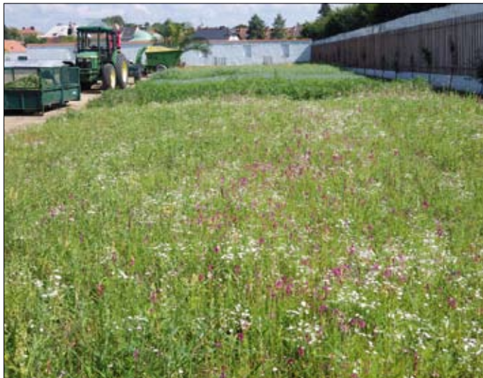
Obr. 20: Tato plocha v Kojetné zahradě v Kroměříži by měla být na podzim osázena sbírkou troalek a keřů. Než se tak stane, byla oseta směsí letniček, která omezí nutnost jejího pletí a zajistí atraktivní vzhled místa.

konci vegetačního období, maximálně dvakrát, a to v případě, že je potřeba na zapleveleném pozemku v 1. polovině roku provést tzv. „na vysoko“ šetrou odplevelovací seč. V dalších letech se postupně prosadí vytrvalé byliny a porost dostane postupně charakter květnaté louky.