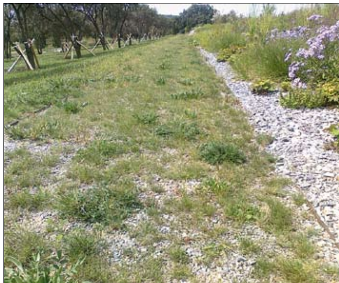
Obr. 21: Použití štěrkového trávniku s příměsí dvouřádkových rostlin na cestě ovocným sadem.

na žádoucí retence v místech, kde se v dnešní době obvykle navrhuje beton nebo asfalt. Právě vsakovací schopnost při současné zatížitelnosti zpevněných vegetačních substrátů ve štěrkových trávnicích zvyšuje značný ekologický význam těchto ploch. Podstatným přínosem použití štěrkových trávníků je podpora biodiverzity na dané lokalitě a z pohledu