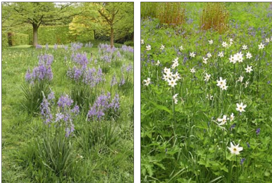
Obr. 9: Cibuloviny i některé druhy trvalek je efektní do travnatých ploch doplnit dosadbou. Následně je nutné oddálit jarní seč do zatažení nadzemních orgánů. (Foto L. Křesadlová, 2003)

listý ( Ranunculus ficaria ), křivatec žlutý ( Gagea lutea ), sněženka ( Galanthus sp.), snědek nízí ( Ornithogalum nutans ), česnek podivný ( Allium paradoxum ) a dalších trvalek jako plicník lékařský ( Pulmonaria officinalis ), popenec obecný ( Glechoma hederacea ), kopytník evropský ( Asarum europaeum ), konvalinka vonná ( Convallaria majalis ), jaterník podléška ( Hepatica nobilis ) a další.