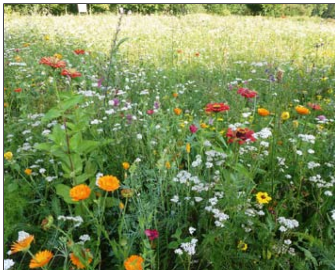
Obr. 19: Přidáním většího podílu letniček do travo-bylinných směsí může být již v roce výsevu dosaženo kladného estetického účinku. To je důležité především na pohledově exponovaných místech s velkou návštěvností.

Důležitým aspektem při volbě těchto směsí je udržení pozemku v bezplevelném stavu v době mezi výsevem směsí a dostatečným vývinem jednoletých rostlin do té míry, že už se další plevele v porostu neprosadí, nebo jsou alespoň při subjektivním vnímání dostatečně potlačeny hýřivou hrou barev kvetoucích rostlin. Období po výsevu směsí (jaro) je nejdůležitější fází pro vytvoření kvalitního porostu v 1. roce. Výsevky směsí květnatých luk s letničkami jsou závislé na podílu šlechtěných letniček, vytrvalých bylin a trav ve směsi a pohybují se mezi 2–5 g/m 2 . Většinou se porosty v roce založení sečou jednou na