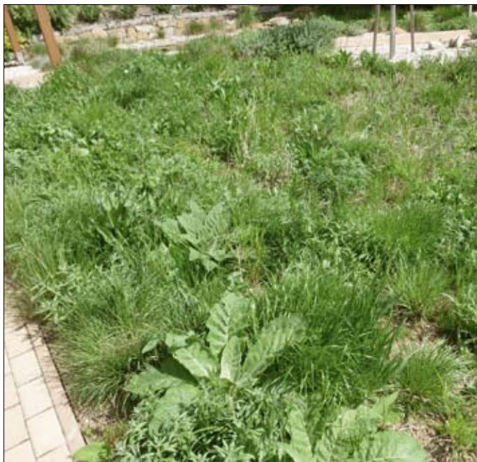
Obr. 4: Při dostatečném odplevelení plochy od vytrvalých plevelů a navezením kvalitního substrátu bez větší zásoby semen jednoletých bylin může již v prvním roce vysetý porost přinést hodnotný estetický účinek.