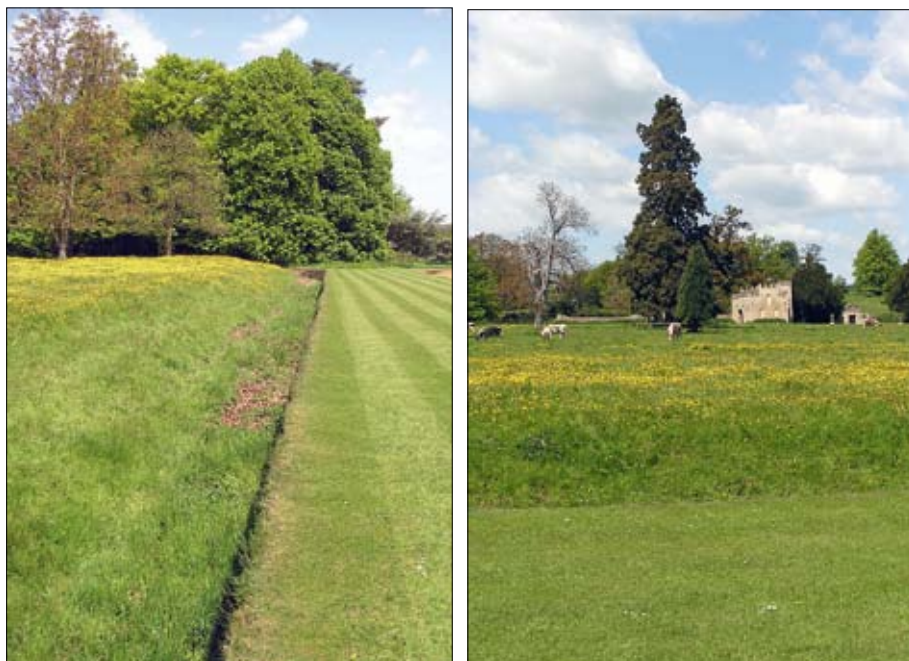
Obr. 1: Parterový trávník před domem odděluje příkop Ha Ha od květnaté louky spásané dobytčím – Rousham.

Travnaté plochy získaly výsadní postavení, spolu se solitérami, skupinami dřevin a porostními hmotami se zařadily mezi základní kompoziční prostředky parkových úprav. Pravidelně udržovaný trávník byl umístován před vstup do obytné budovy a přecházel v rozlehlé květnaté louky spásané hospodářskými zvířaty a lesní zvěří.