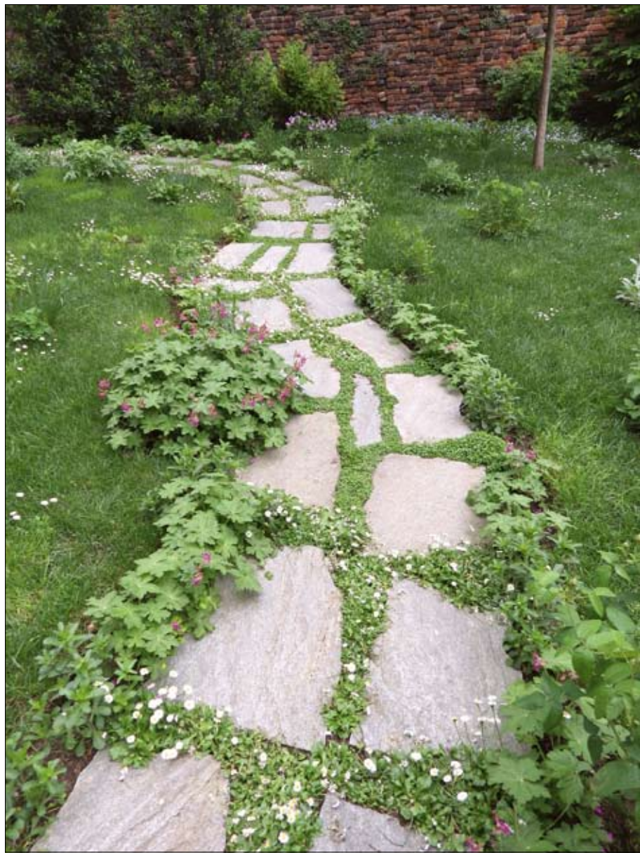
Obr. 25: Osetí spár mezi kamennými šlapáky směsí bylin v evokaci středověké zahrady v Turíně.