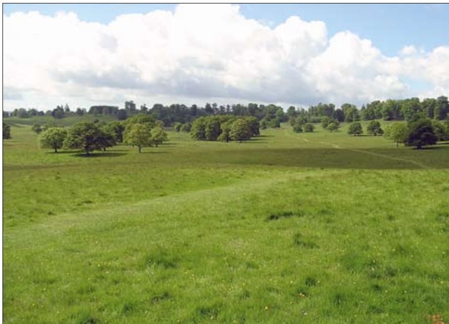
Obr. 2: V kompozicích architekta Lancelota Browna hrály travnaté plochy spásané zvěří zásadní roli – Petworth Park.

V New Principles of Gardening z roku 1728 Batty Langley uvádí, že přední část domu má být otevřena k elegantnímu trávníku ozdobenému sochami a na krajích zakončenému volnými skupinami stromů. V zahradě měla být naplňována tři pravidla, a to kontrast, moment překvapení a skrytí hranic. Travnaté plochy sloužily především k navozování kontrastů a integrovaly v sobě příkopy tvořící „neviditelnou“ hranici mezi vlastní zahradou a okolní krajinou.