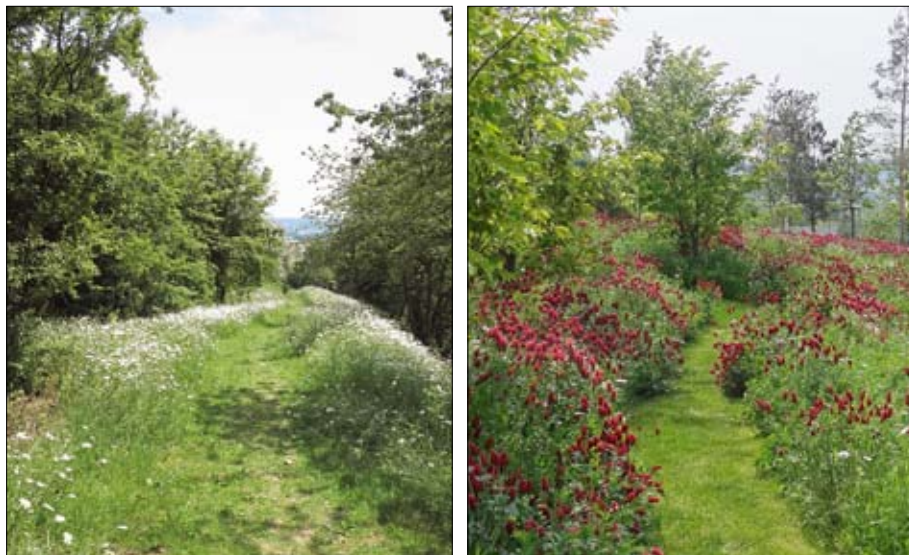
Obr. 12: Výsevem směsí bohatých na vytrvalé i jednoleté byliny lze výrazně zatraktivnit okolí cest a dalších často navštěvovaných míst v zahradě. (Foto M. Straková, 2013)