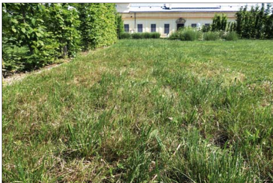
Obr. 18: Travo-bylinný porost po provedení seče, při které by měly být co nejméně narušeny listové růžice dvouděložných bylin, proto by její výška měla být 8–10 cm. (Foto L. Křesadlová, 2015)

V druhově pestrých travních porostech neprodukčního charakteru není vhodné, ani ekonomicky zdůvodnitelné minerální hnojení dusíkem a používání agrochemikálií, které přispívají ke zhoršení druhové diverzity. Nadměrný přísun živin, hlavně dusíku, podporuje zvyšování podílu travních druhů, např. ovsíku vyvýšeného ( Arrhenatherum elatius ), srhy laločnaté ( Dactylis glomerata ), lipnice luční ( Poa pratensis ) aj., které následně svým nadměrným rozvojem v porostu konkurují slabším druhům.