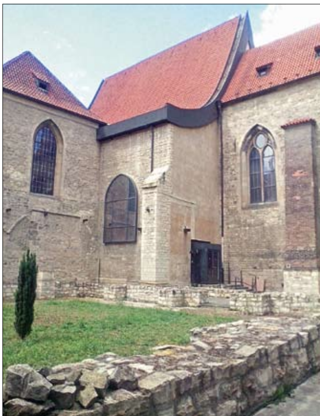
Obr. 24: Torzo původní zdi ambítu menších bratří v areálu kláštera so. Anežky České na Starém Městě v Praze před restaurátorskou obnovou zdiiva, spojenou s doplněním vegetační vrstvy v koruně zdiiva a výsevem travo-bylinné směsi. (Foto M. Straková, 2015)

Technické složky historických zahrad, jako jsou schody, zídky nebo dlažby, popř. i mobiliář, zejména lavičky, bývají často kombinovány s rostlinami s cílem je oživit, upoutat nebo jinak ozvláštnit. Druhově pestré směsi do kamenných spár dlažby vycházejí opět z možností stanoviště a obsahují kromě trav také významný podíl nízkých kvetoucích a aromatických bylin.