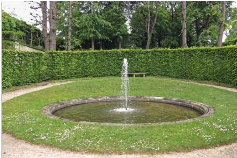
Obr. 10: Pravidelně sekaný parterový trávnik s podílem dvouděložných bylin v barokní zahradě v Grob-sedlitz.

V historických zahradách se jedná o bylinné trávniky, jejichž estetická působivost je dána zapojeným nízkým, různobarevně kvetoucím porostem, v němž jsou ve značné míře zastoupeny především sedmikrásky ( Bellis sp. ). Parterové trávniky mají širokou druhovou diverzitu. V porostu jsou přítomny nejenom trávy, ale také byliny jako řebříček obecný ( Achillea millefolium ), svízel syřišťový ( Galium verum ), pampeliška obecná ( Taraxacum officinale ), kopretina bílá ( Leucanthemum vulgare ), jitrocel prostřední ( Plantago media ), černohlávek obecný ( Prunella vulgaris ), pryskyřník hlíznatý ( Ranunculus bulbosus ), mateřídouška ( Thymus sp. ), hvozdík ( Dianthus sp. ) a jeteloviny – štirovník růžkatý ( Lotus corniculatus ), tolíce dětelová ( Medicago lupulina ). Jetel plazivý ( Trifolium repens ), zvláště drobnolisté odrůdy, se jeví jako vhodný doplněk do těchto nízko sečených bylinných trávniků v méně příznivých podmínkách, v nichž zvyšuje odolnost k suchu a dodává potřebný dusík. Trávnik velmi dobře plní protierozní funkci a vyžaduje nižší úroveň péče, která spočívá pouze v pravidelném sečení. Hnojení ani ošetření herbicidy nepřipadá v úvahu, protože právě tento režim následné péče podmiňuje výskyt sedmikrásky chudobky ( Bellis perrenis ), jejíž osivo je v podstatě nedostupné a do směsi se nedá získat.