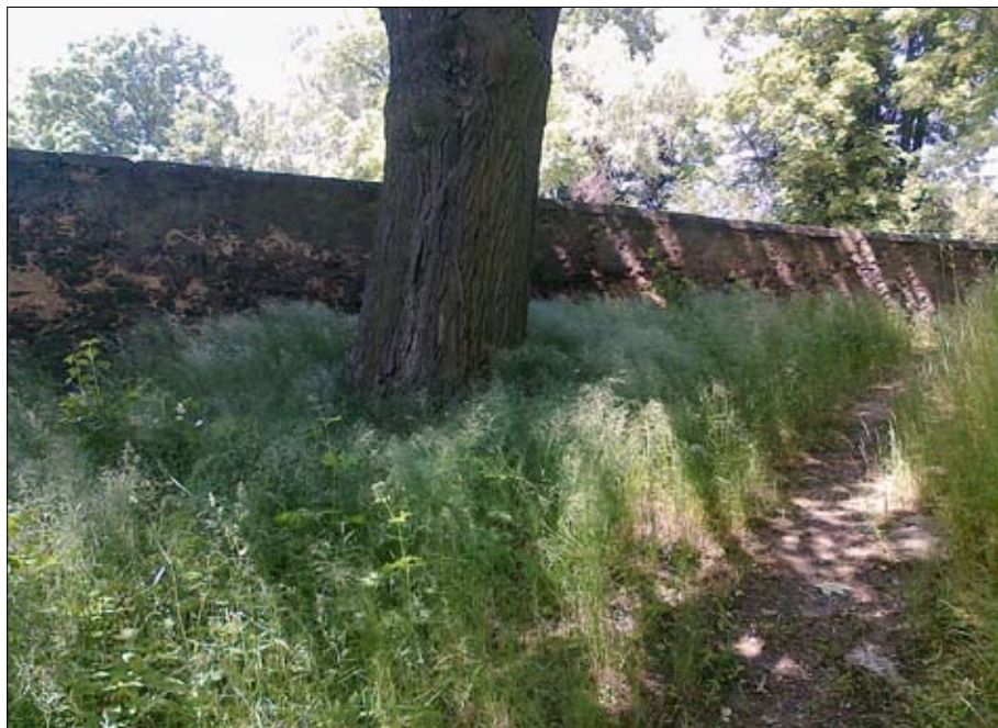
Obr. 11: Výsevní směs určená do stínu obsahuje větší podíl Poa nemoralis , stav porostu 5 let po výsevu.