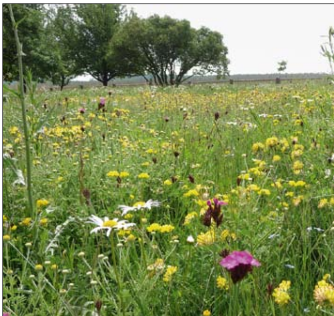
Obr. 5: Je-li zvolena správná směs vzhledem k podmínkám stanoviště a plocha kvalitně připravena, již v druhém roce po výsevu se dvouděložné byliny v porostu plně uplatní (směs Slunovrat, Agrostis Trávníky, s. r. o.).