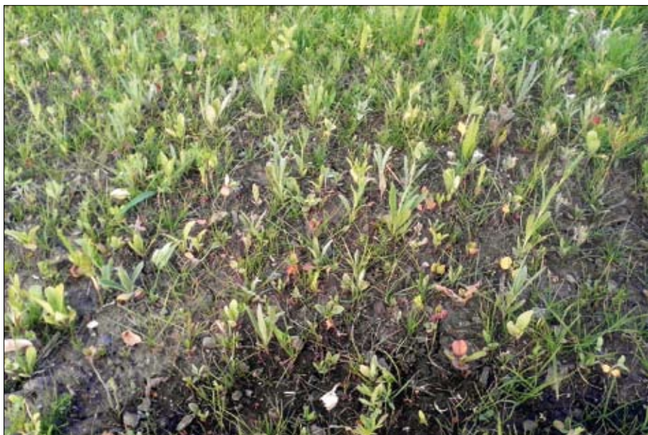
Obr. 8: Vrcházející porost směsi trav, vytrvalých dvouděložných rostlin a letniček.