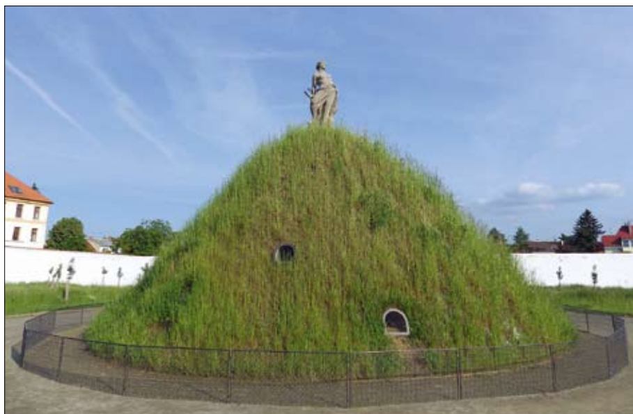
Obr. 16: Kvetoucí jíłek vytrvalý chrání (stíní) suchomilné byliny a trávy s pomalejším úvoojem. Po vymizení jíłku z porostu bude především na jižně orientovaném svahu nutné provést na některých místech dosev suchomilných druhů rostlin.