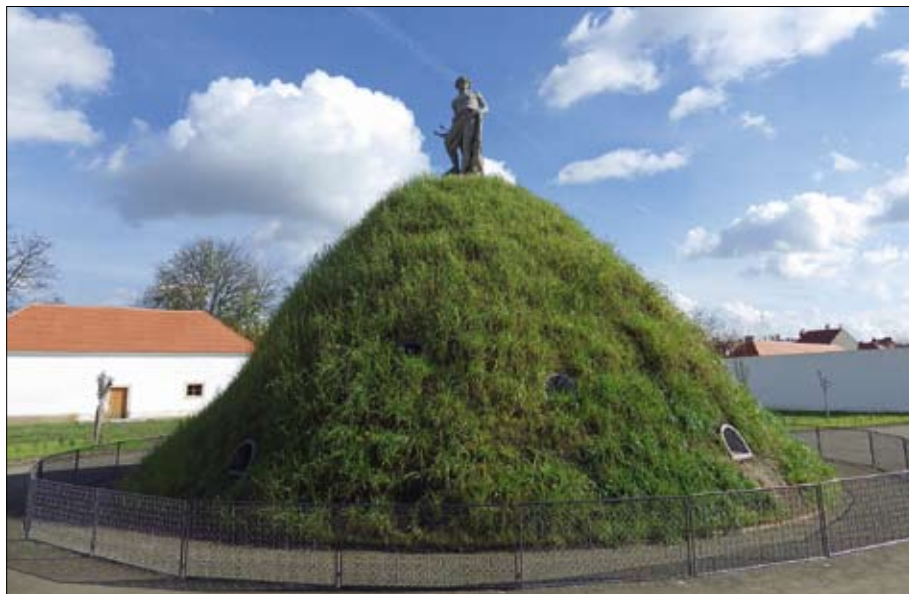
Obr. 15: Svahy Králičího kopce v Koětně zahradě byly nejdříve osety směsí s výrazným podílem jíłku vytrvalého, aby byl v krátké době získán zelený porost.